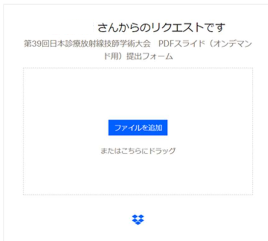
① 【ファイルを追加】をクリック

◆以下の手順でアップロードをお願いします。なお、 自身の Dropbox をご使用の方はログアウトしたうえで、操作をお願いします。