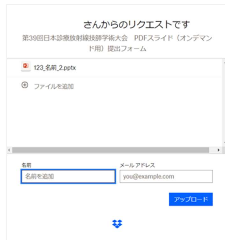
④名前とメールアドレスを入力