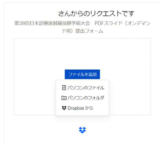
②アップロードするファイルの場所を選択