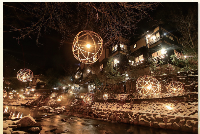
冬に見られる「湯あかり」